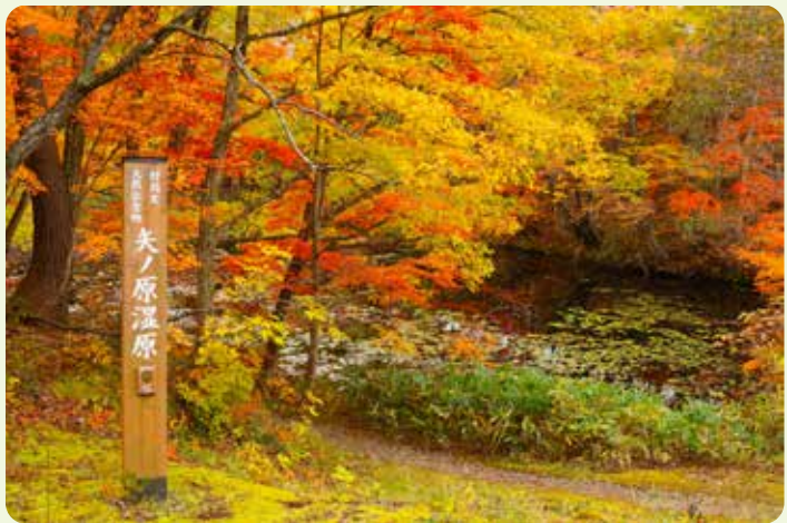
秋は一面が色鮮やかな紅葉に彩られます。 (②の場所で10月下旬に撮影)