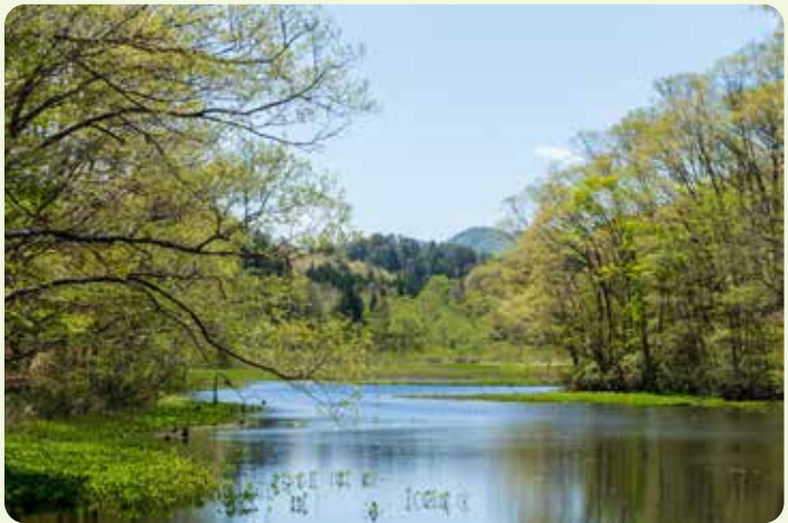
春は目にまぶしい新緑の季節。 (①の場所で5月中旬に撮影)