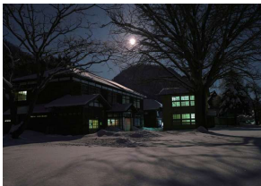
佳作「月夜の喰丸小」