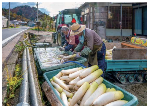
昭和村観光協会長賞「ミネラル分最高の昭和村の大根」

写真を見た方に「昭和村に行ってみたい」と思ってもらえるような、 昭和村の 魅力が伝わる新鮮な視点や構図 の作品をお待ちしています。