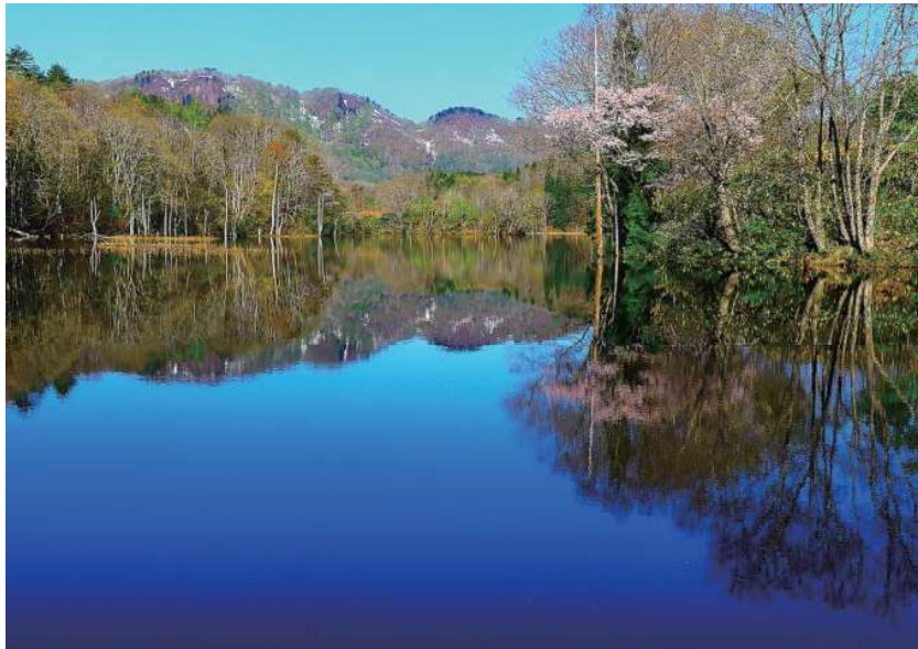
昭和村長賞「矢の原沼の春」