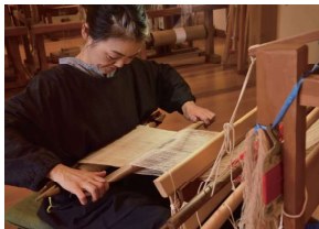
佳作「一重二重と重なりて」