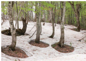
佳作「ブナの根開き」