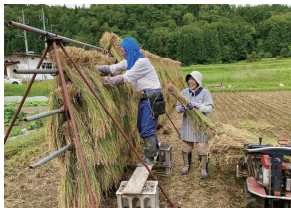
佳作「今年も豊作だ」